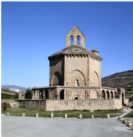
Iglesia de Santa María de Eunate

La Iglesia de Santa María de Eunate, situada a las afueras de Muruzabal es una de las más sorprendentes que encontraremos en el Camino de Santiago. De estilo románico, fue construida en el siglo XII. La arquería poligonal que la rodea es el origen de su nombre, ya que Eunate significa cien puertas en euskera. Sea cual fuere el origen del templo, la mayor parte de las hipótesis coinciden en su función cementerial al servicio de los peregrinos fallecidos en el Camino de Santiago (en varios de los enterramientos excavados se han encontrado las tradicionales conchas de los peregrinos).