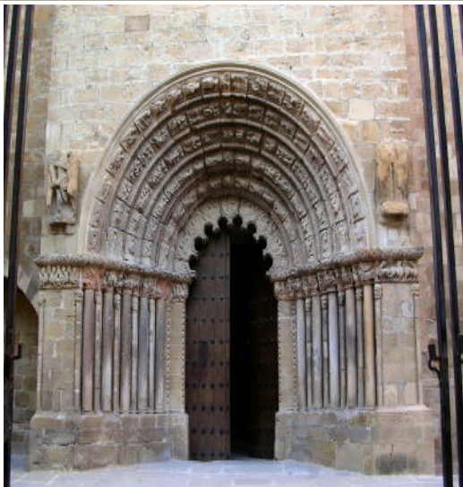
Puente La Reina

Típica ciudad de peregrinación, sus calles principales siguen la originaria ruta jacobea. Incluso, el famoso puente que se encuentra a la salida de la población fue construido para facilitar el paso a los peregrinos sobre el río Arga. Sigue manteniendo casi intactas todas las esencias de la ruta medieval.