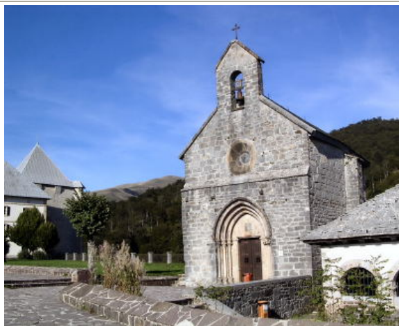
Capilla de Santiago (Roncesvalles)

Junto al pequeño claustro gótico se halla la sala Capitular del siglo XIV, donde reposan los restos de Sancho el Fuerte, rey navarro conocido tanto por su corpulencia (medía más de dos metros) como por su victoria ante los musulmanes en la batalla de las Navas de Tolosa (1212); en esta sala se encuentran las mazas de guerra del rey y las cadenas que éste arrancó de la tienda del Califa y que son el símbolo del reino de Navarra. La Capilla de Santiago o de los Peregrinos (s.XIII) es sencilla pero muy histórica. A unos 300 metros en dirección a Burguete y a mano izquierda de la carretera se encuentra la Cruz de los Peregrinos , crucero gótico del siglo XV.