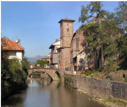
Saint Jean Pied de Port

Algunas calles antiguas, bordeadas de dignos edificios, la iglesia y el viejo puente románico completan el atractivo cuadro.