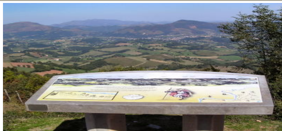
Tablero de orientación