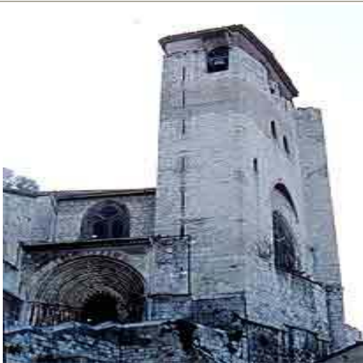
San Pedro de la Rúa

Guzmán y Santa Clara, fundados en el siglo XIII; y el Palacio de los Reyes de Navarra, en el siglo XII.