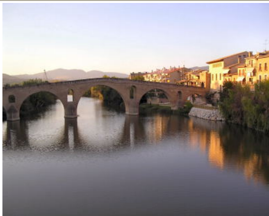
Puente de los peregrinos