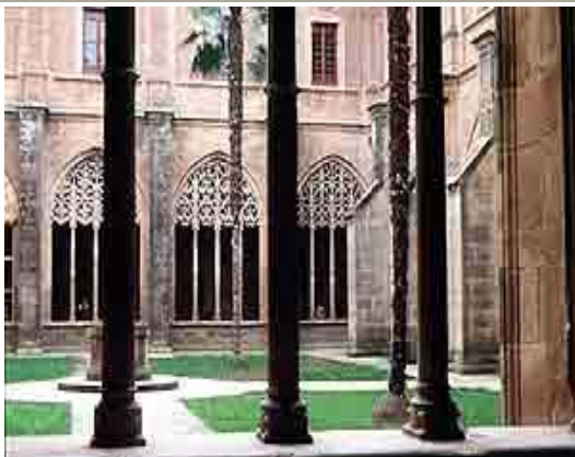
Claustro de Santa María La Real

Muchos peregrinos, al llegar a Nájera no continuaron en dirección oeste, sino hacia el sur, ascendiendo a la vera de la vigorosa corriente del Najerilla, para adentrarse luego hasta San Millán y Berceo, en tierra más escabrosa y arbolada.