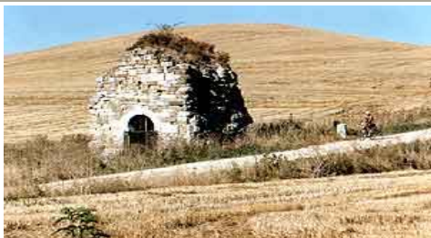
Restos de San Félix (Villafranca)

Hoy es una modesta localidad que prepara al caminante para llegar a los antiguamente temidos Montes de Oca por la gran cantidad de bandidos que acechaban a los peregrinos. Ahora se ha convertido en una de las etapas más agradables del Camino, sobre todo en Castilla, pues discurre por frondosos bosques de robles, donde el viajero podrá disfrutar de tranquilidad y naturaleza virgen.