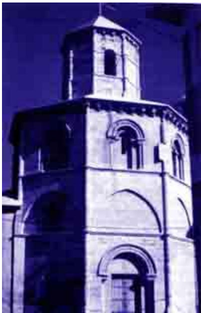
Enigmática Iglesia del Santo Sepulcro

La decoración escultórica está relacionada con el Santo Sepulcro de Jerusalén. Por la vinculación a estructuras cordobesas, se ha especulado con la posibilidad de que el monumento fuera construido por artesanos mudéjares venidos desde la orilla del Guadalquivir.