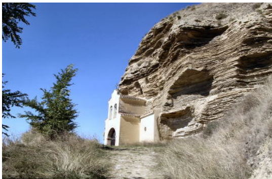
Ermita de la Virgen de la Peña

El pueblo data del año 940, en él se puede observar la ermita rupestre dedicada a la Virgen de la Peña, y las cuevas de los Arancones.