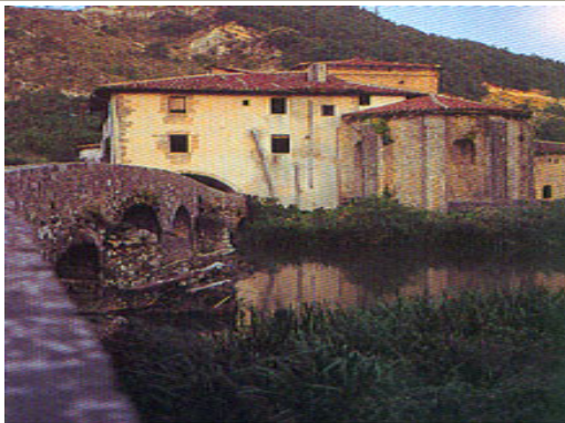
Basilica románica de la Santísima Trinidad

Hotel y pensión. Todo tipo de servicios.