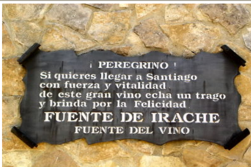
Fuente del Vino de Irache