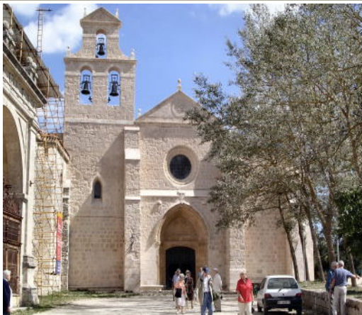
San Juan de Ortega