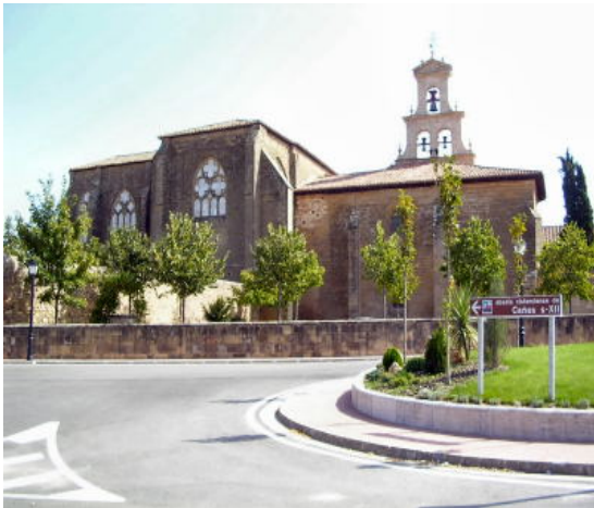
Monasterio de Cañas