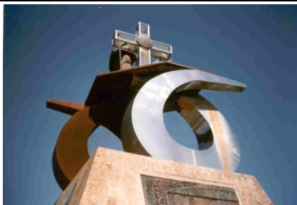
Monumento conmemorativo de la visita de Juan Pablo II

En la actualidad, la ladera suroeste de esta mítica colina ha sido deforestada y cimentada y está en servicio un macro complejo en el que tienen cabida un auditorio al aire libre con capacidad para 30.000 personas y un gran centro de acogida de peregrinos.