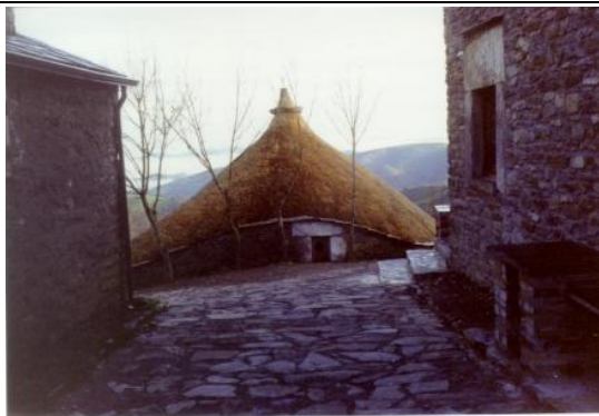
Pallozas en O Cebreiro

El pueblo de O Cebreiro constituye un mirador excepcional en la geografía gallega pues al estar flanqueado por las sierras del Caurel y de los Ancares, la línea de cumbres de esta última se divisa desde aquí, en dirección norte, con asombrosa perfección.