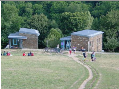
Albergue de Triacastela

Santiago de Triacastela documentado desde el año 922, fue final de la XI etapa del Camino según el Códex Calixtinus. Debe su apellido a los tres castillos que hubo en su término y de su hospitalidad dan prueba su nombre y el de sus calles.