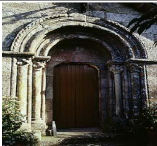
Palas de Rei

Códex Calixtinus, es hoy una moderna población de cemento y ladrillo en la que poco queda de su época de esplendor jacobeo. Sólo una estatua del Apóstol, una fuente coronada por un anónimo peregrino y una pequeña calle que lleva por nombre Travesía del Peregrino dan fe de la importante tradición jacobea de esta villa, que llevó a Aymeric Picaud a hacer aquí su última escala antes de llegar a Compostela. De la primitiva iglesia de San Tirso se conserva únicamente la portada románica de su fachada occidental, muy sencilla, construida a finales del siglo XII o principios del XIII. A la salida de la población se encuentra el lugar conocido como “Campo dos Romeiros”, donde los peregrinos se reunían al salir el sol antes de iniciar la última jornada que les llevaría a Santiago. No muy lejos, se encuentra el antiguo monasterio de San Salvador de Vilar de Donas, perteneciente a la Orden de Santiago.