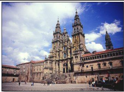
Catedral de Santiago

Al pie del pilar del Apóstol pero por lado opuesto está la popular figura del "Santo dos Croques" sobre la que, según manda la tradición, hay que golpear con la cabeza a fin de despejar "las entendederas".