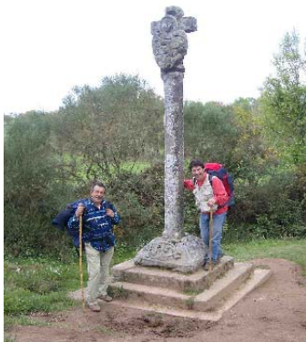
Cruceiro de Lameiros