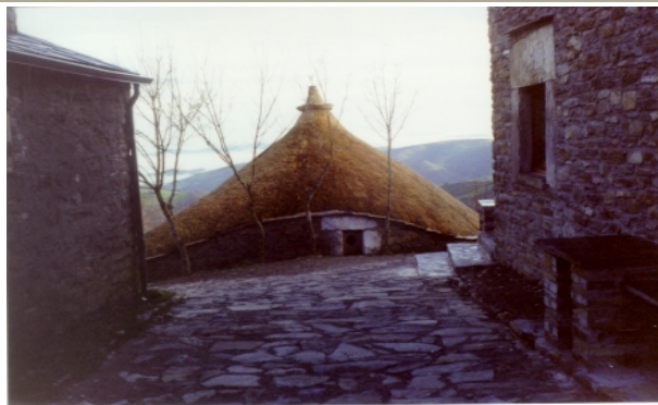
Pallozas en O Cebreiro

El pueblo de O Cebreiro constituye un mirador excepcional en la geografía gallega pues al estar flanqueado por las sierras del Caurel y de los Ancares, la línea de cumbres de esta última se divisa desde aquí, en dirección norte, con asombrosa perfección.