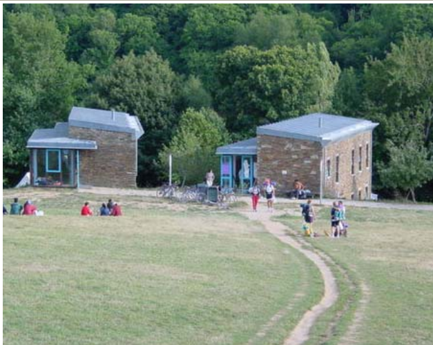
Albergue de Triacastela

Santiago de Triacastela documentado desde el año 922, fue final de la XI etapa del Camino según el Códex Calixtinus. Debe su apellido a los tres castillos que hubo en su término y de su hospitalidad dan prueba su nombre y el de sus calles.